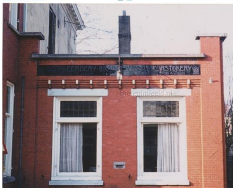
Foto uit 1942. Naast het kantoor was hotel De Kroon gevestigd.