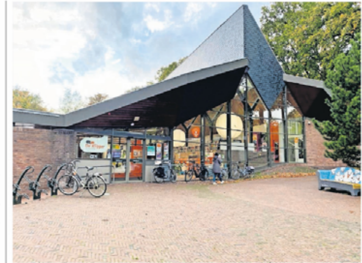
▲ De bibliotheek in Oosterbeek.

Dat een bibliotheek intrekt bij een gemeentehuis is geen nieuw fenomeen. Dat gebeurt al op meer plekken in Nederland, zoals bijvoorbeeld in Waalre. Het zorgt voor meer leven in een gebouw, zeker als er horeca bij komt. De locatie van de huidige bibliotheek, De Klipper, zou dan vrij ko-