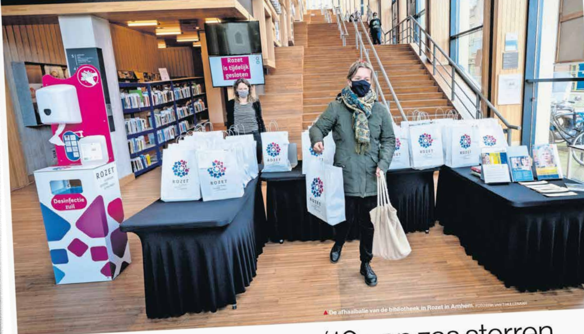
▲ De afhaalbalie van de bibliotheek in Rozet in Arnhem.

hun DigiD, proef je soms irritatie. ‘DigiD? Wat is dat dan?’” Vandaag is het rustig, stelt Berends. „De eerste golf is voorbij”, grapt ze. „Blijft de QR-code langer, verwacht ik een tweede golf.” De telefoon gaat. Een vrouw zonder smartphone, computer en dus ook zonder DigiD. Omdat de dame een telefoon met een draaischijf heeft, kan ze tijdens het bellen van het 0800-nummer haar Burgerservicenummer niet intoetsen, om een papieren QR-