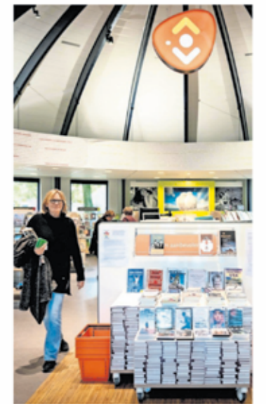
▲ De bieb.

pandeigenaar over verschillende voorwaarden. We hopen binnen een paar weken meer duidelijkheid te hebben”, laat een gemeentewoordvoerder weten. Mochten alle partijen eruit komen, dan moet ook de gemeenteraad nog akkoord gaan.